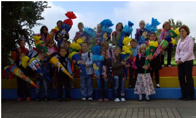
Klasse 1 a