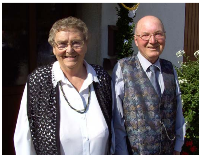
Unser Bild zeigt das Jubelpaar.